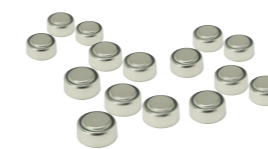
Grote hoeveelheden knoopcellen