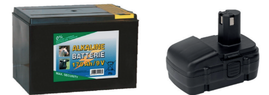
Weidebatterijen en grote accu's