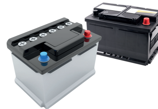
Tractie- en autobatterijen