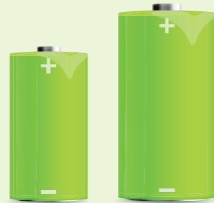
C- en D-batterijen